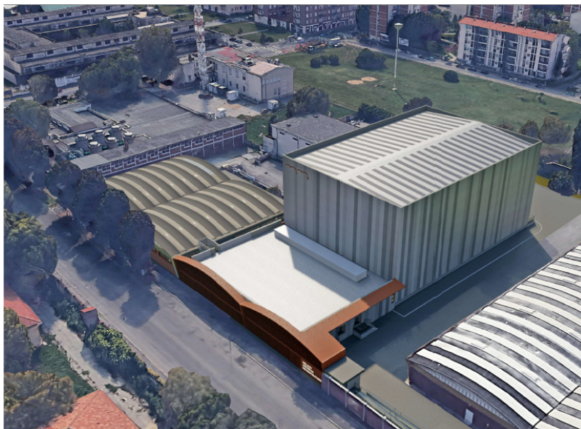
Fig. 01 - Render di progetto: in primo piano, lo Spazio Baie con la quinta in corten e l'archivio meccanizzato

Nelle due figure di seguito riportate (cfr. Fig. 01 e Fig. 02 e Fig. 03 ) una rappresentazione di quanto sopra descritto.