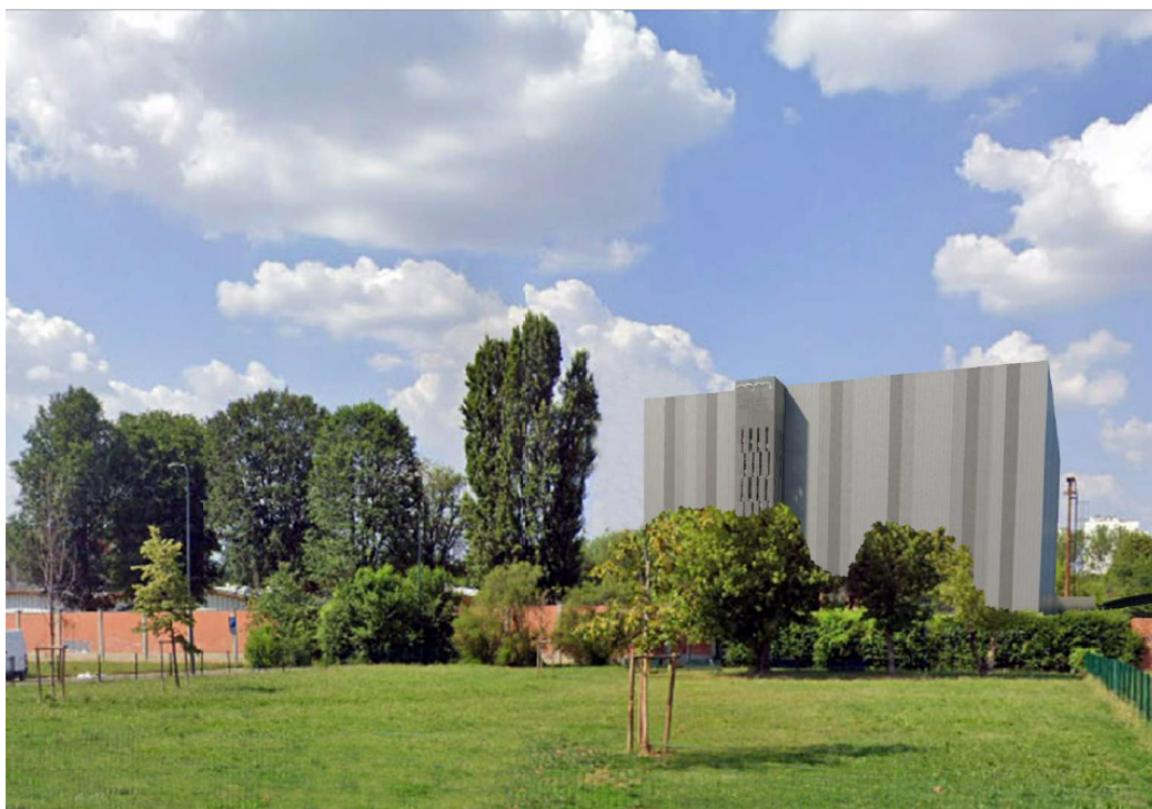
Fig. 02 - Render di progetto: l'archivio da Via Racconigi