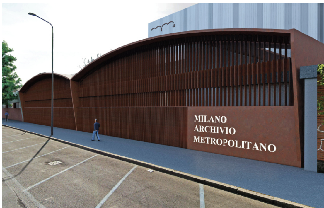
Fig. 03 - Render di progetto: vista da via Gregorovius